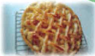
カスタード作りハマっていた時に作ったアップルカスタードパイとイチゴカスタードシュー