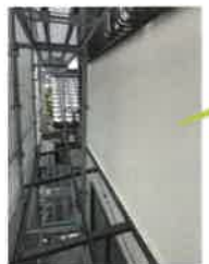
点検中の作業現場