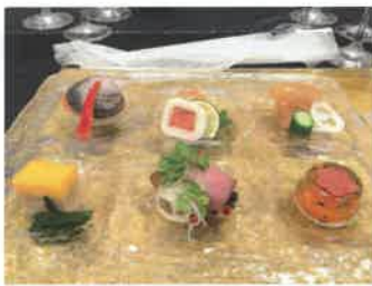
披露宴で出された料理。 次は自分がふるまう側 になりたい・・・

皆さんゴールデンウィークはどうお過ごしになりましたか？ 10連休の大半を休んでしまったばかりに僕は正直仕事に行くのが少し嫌 になりました（笑）もう連休は懲り懲りです（笑）