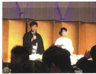
幸せいっぱいの新郎新婦。 お幸せに！