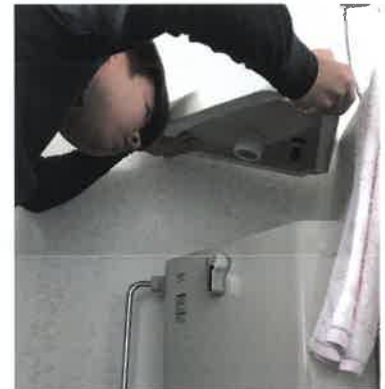
水浸しになった時の再現シーン 「もう大丈夫です!!」と本人談（笑）