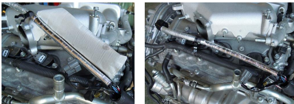
Throttle extension harness