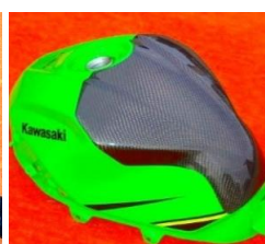
'18~ Ninja250/400 平/綾 (18NI-108-02/03)