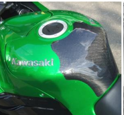
'12~ ZX-14R '10~ 1400GTR 平/綾 (ZX14-108-02/03)