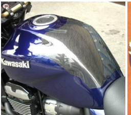
ZRX1200 DAEG 平/綾 (DAEG-108-02/03)