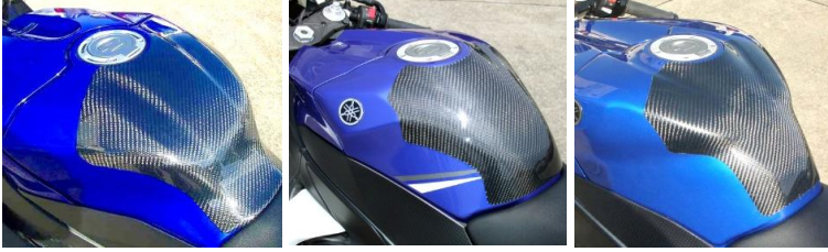
'15～ YZF-R1 (R1M) '09～'14 YZF-R1 '07～'08 YZF-R1 平/綾 (15R1-108-02/03) 平/綾 (09R1-108-02/03) 平/綾 (07R1-108-02/03)