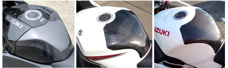
'21～ Hayabusa '08～'20 ハヤブサ ～'07 ハヤブサ 平/綾 (21HA-108-02/03) 平/綾 (08HA-108-02/03) 平/綾 (HAYA-108-02/03)