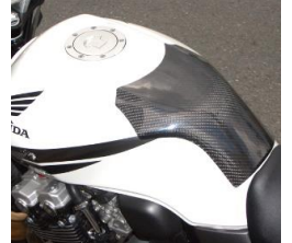
'99~CB400SF 平/綾 (99CB-108-02/03)