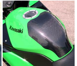
'08~'12 Ninja 250R 綾織 (NI25-108-03)