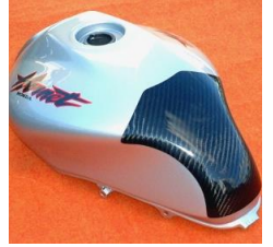
ホーネット250.600 平/綾 (HORN-108-02/03)