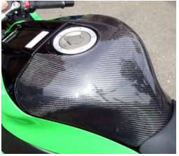
※2 '11~ ZX-10R 平/綾 (11ZX1-108-02/03)