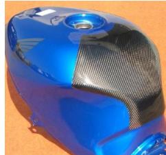
CBR1100XX 平/綾 (CBXX-108-02/03)