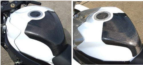
'11～ GSX-R600/750 '08～'10 GSX-R600/750 平/綾 (11G6-108-02/03) 平/綾 (08G6-108-02/03)