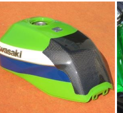
'96-'08 ZRX1100/1200 平/綾 (ZRX-108-02/03)