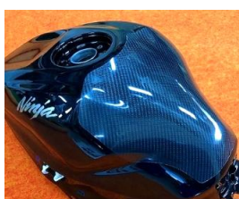
'24~ ZX-4R '19~ ZX-25R 平/綾 (ZX4R-108-02/03)