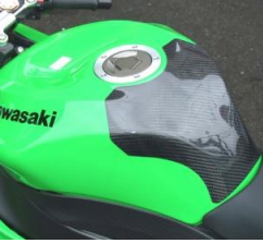
'09~ ZX-6R 平/綾 (09ZX6-108-02/03)