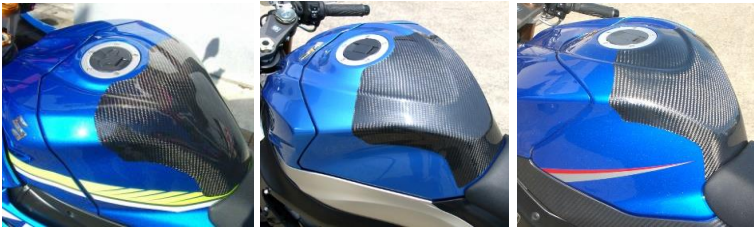
'17～ GSX-R1000(R) '09～'16 GSX-R1000 '07～'08 GSX-R1000 平/綾 (17G1-108-02/03) 平/綾 (09G1-108-02/03) 平/綾 (07G1-108-02/03)