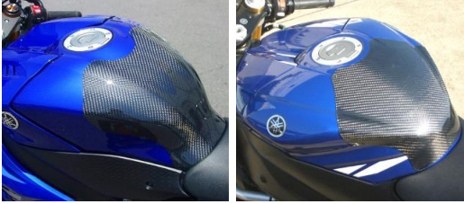
'17～ YZF-R6 '08～'16 YZF-R6 平/綾 (17R6-108-02/03) 平/綾 (08R6-108-02/03)