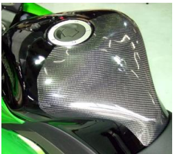
'11~ Ninja 1000 平/綾 (NI10-108-02/03)