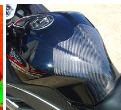
'13~'17 Ninja/Z250 平/綾 (13NI-108-02/03)