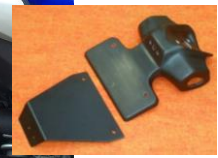
'15~ YZF-R1/R1M (15R1-005-31) ¥17,600-(¥16,000-)