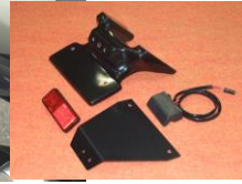
'07~'08 GSX-R1000 (07G1-005-31) ¥20,900-(¥19,000-)