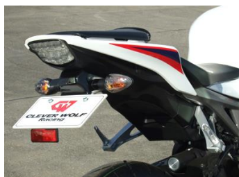
'10~'16 CBR1000RR (10CB-005-31) ¥22,000- (¥20,000-)