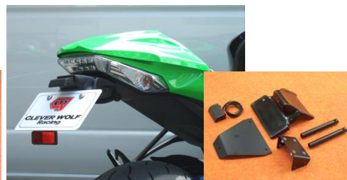
'11~'15 ZX-10R (11ZX1-005-31) ¥24,200- (¥22,000-)