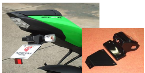
'08~'10 ZX-10R (08ZX1-005-31) ¥17,600- (¥16,000-)