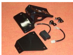
'08~'09 CBR1000RR (08CB-005-31) ¥22,000- (¥20,000-)