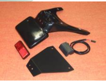
'08~'20 ハヤブサ 1300 (08HA-005-31) ¥20,900-(¥19,000-)