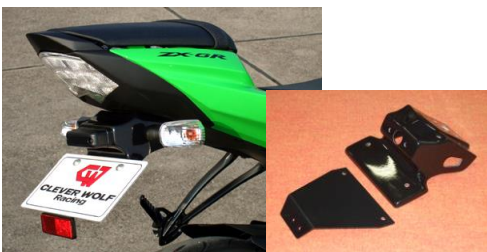
'09~'16 ZX-6R (09ZX6-005-31) ¥17,600- (¥16,000-)