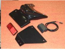
'09~'16 GSX-R1000 (09G1-005-31) ¥20,900-(¥19,000-)