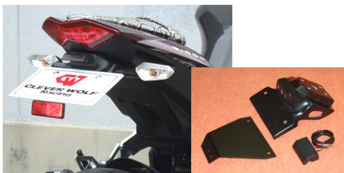
'10~'13 Z1000 (10Z1-005-31) ¥20,900- (¥19,000-)