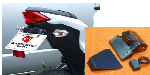
'13~'17 Ninja 250/Z250 (13NI-005-31) ¥20,900- (¥19,000-)