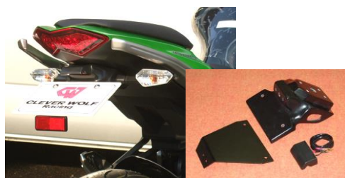
'11~'16 Ninja 1000 (NI10-005-31) ¥20,900- (¥19,000-)