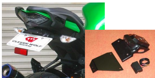
'17~ Ninja 1000 (17NI-005-31) ¥20,900- (¥19,000-)