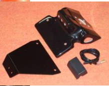
'08~'16 YZF-R6 (08R6-005-31) ¥20,900-(¥19,000-)