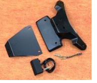
'21~ Hayabusa (21HA-005-31) ¥23,100-(¥21,000-)