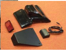
'11~ GSX-R600/750 (11G6-005-31) ¥20,900-(¥19,000-)