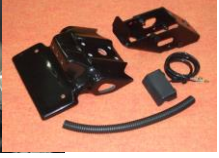
'09~'14 YZF-R1 (09R1-005-31) ¥28,600-(¥26,000-)