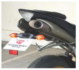
'07~'08 YZF-R1 (04R1-005-31) ¥28,600-(¥26,000-)