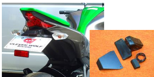
'18~ Z1000/'14~'17 Z1000 (18Z1 / 14Z1-005-31) ¥20,900- (¥19,000-)