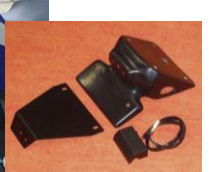
'14~'18 YZF-R25/R3 (14R2-005-31) ¥20,900-(¥19,000-)