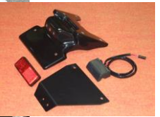
'08~'10 GSX-R600/750 (08G6-005-31) ¥20,900-(¥19,000-)