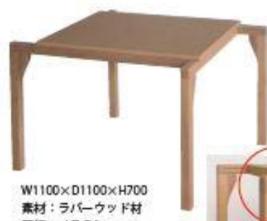
W1100×D1100×H700 素材：ラバーウッド材 天板：メラミン