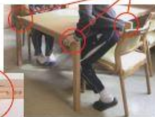
手すりの拡大写真