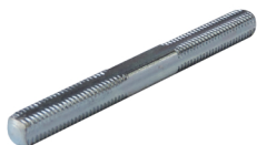
ドアノブ用芯棒 【DS-1】 715 円 (税込)