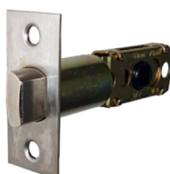
ドアノブ用ラッチ シルバー バックセット 60/70mm 【LT-2S】 1,320 円 (税込)