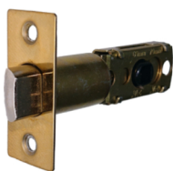
ドアノブ用ラッチ ゴールド バックセット 60/70mm 【LT-2G】 1,320 円 (税込)