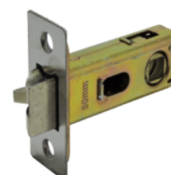
レバーハンドル用 バックセット 50mm 【LT-50】 1,320 円 (税込)