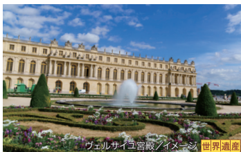
ヴェルサイユ宮殿/イメージ 世界遺産

数あるフランス宮殿の中でも最も華やかなのはここ、ヴェルサイユ。フランス王政絶頂期に建てられた、当時の豪華を今に伝える壮麗なこの宮殿を見ずして、フランスは語れません。特に豪華なシャンデリアで飾られた「鏡の間」は見事です。