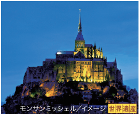
モンサンミッシェル/イメージ 世界遺産

※右記マップ内いずれかのホテルとなります。 ※修道院は外観のみの観光となり、入場はできません。