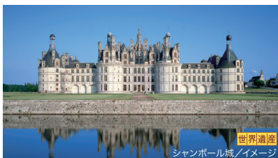
シャンボール城/イメージ 世界遺産

華麗なフランス・ルネッサンスを象徴する白亜のシャンボール城や、ロワールの水面に映る流麗なシュノンソー城など、王侯貴族に愛されたロワール地方へご案内します。