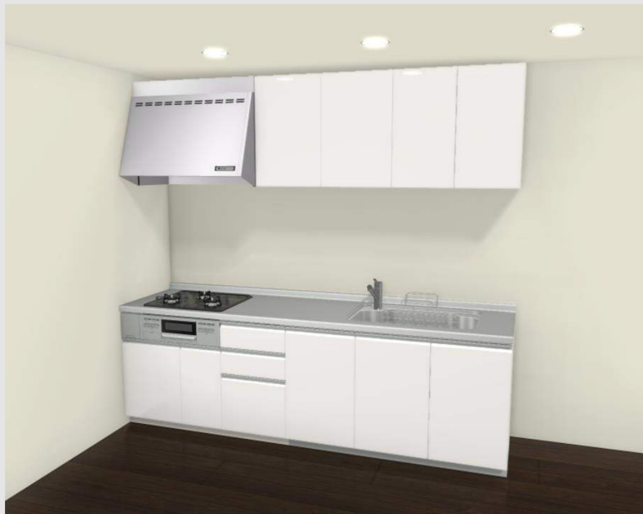
CG合成によるイメージ画像です。 現場調達品、シリーズ外選定品に関しては表現しておりません。