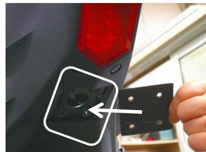
(写真⑤ フェンダープレート)

(注意) このカウルは、ノーマルラジエーター対応です。 ラジエーターを変更している場合は、カットが必要になる場合があります。 ノーマルマフラーでもこのカウルは装着できますが、絶対にエンジンを始動しないでください。 触媒の発熱でカウルが焦げて燃えてしまいます。レーシングマフラーに装着してください。 アンダーカウルは全てのマフラーに対応している訳ではありません。 マフラーの種類によっては、カット、その他加工が必要になる場合があります。