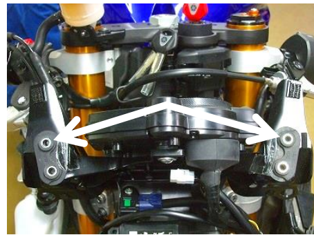
(写真① アッパーステー)