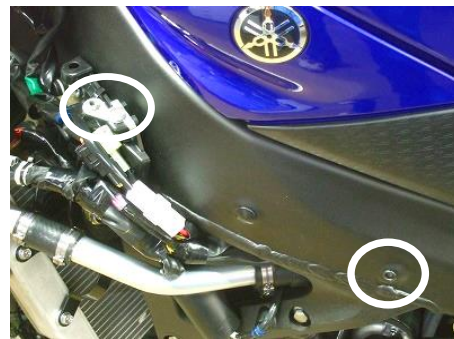
(写真② フレームサイド)