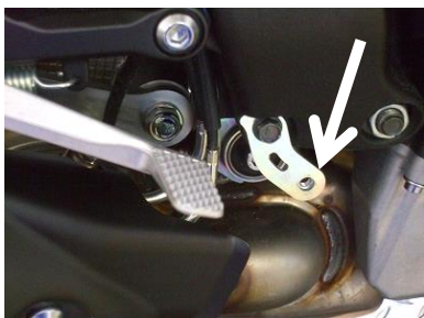
(写真③ フレーム右下)