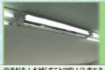
蛍光灯を1本減らすことで約1/2省エネ